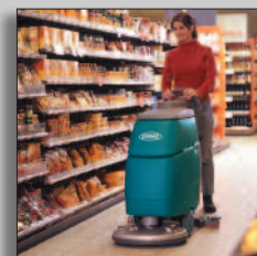
Machine en action