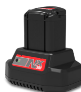
913686 - BATTERIE LITHIUM ION NX300