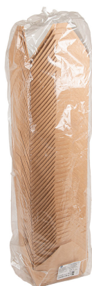
Image du paquet

Convient aux aliments humides et gras mais pas aux liquides chauds