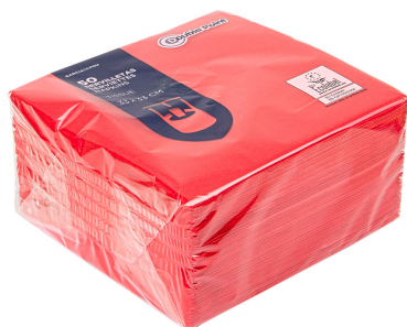
Image du paquet

Règlement (CE) n° 2023/2006 de la Commission du 22 décembre 2006 relatif aux bonnes pratiques de fabrication des matériaux et objets destinés à entrer en contact avec des denrées alimentaires.