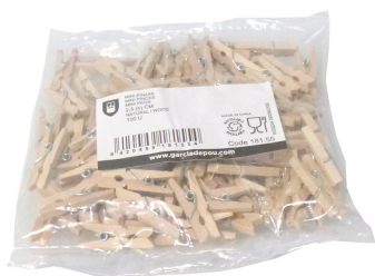
Image du paquet

Règlement (CE) n° 2023/2006 de la Commission du 22 décembre 2006 relatif aux bonnes pratiques de fabrication des matériaux et objets destinés à entrer en contact avec des denrées alimentaires.