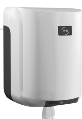
REF 8 99 605 Cleanline Dévidoir maxi capot blanc UL 1 : 6