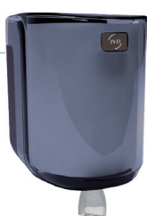
REF 8 99 737 Cleanline Dévidoir maxi capot transparent fumé UL 1 : 6