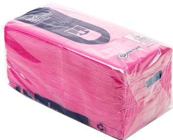
Image du paquet

Règlement (CE) n° 2023/2006 de la Commission du 22 décembre 2006 relatif aux bonnes pratiques de fabrication des matériaux et objets destinés à entrer en contact avec des denrées alimentaires.