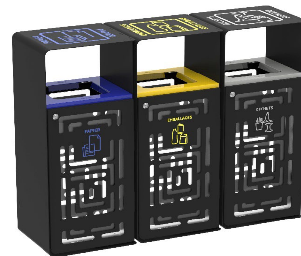
Solution de tri des déchets optimum en îlot