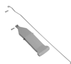
Kit pédale pour support sac Magic