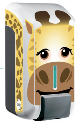
REF 8 44 479KIDS Cleanline Gel Kids Inclus dans le pack Kids