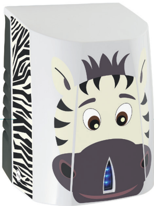
REF 8 11 1056KIDS Sup'air Kids