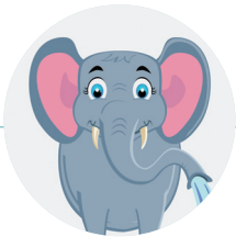
Plaque* Éléphant PVC à placer derrière le robinet.