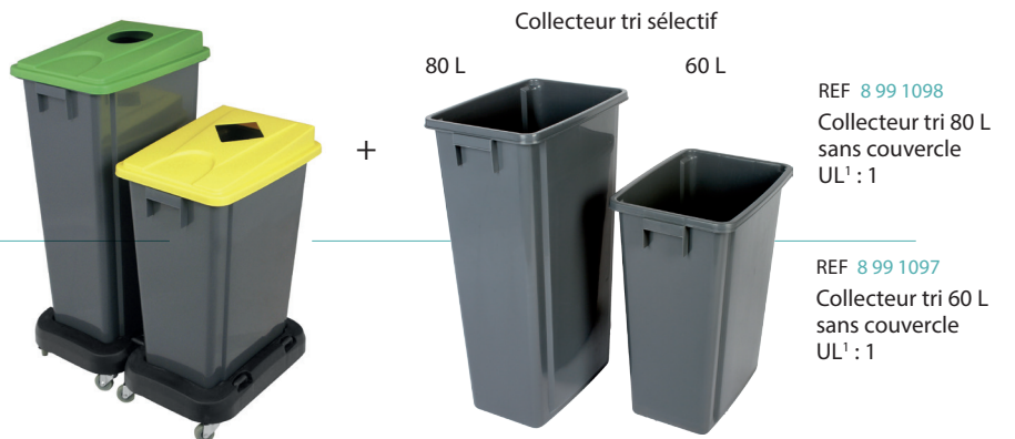
Collecteur tri sélectif