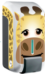
REF 8 44 479KIDS Cleanline Gel Kids Inclus dans le pack Kids