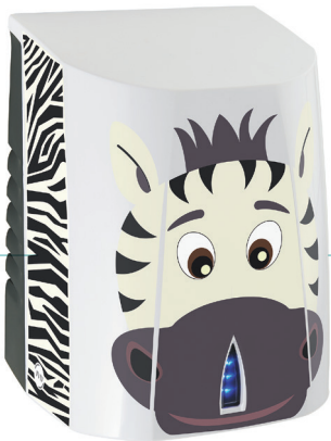
REF 8 11 1056KIDS Sup'air Kids